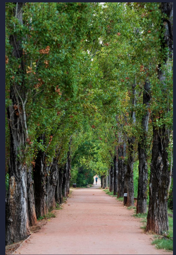
Parcours Bord de Siagne