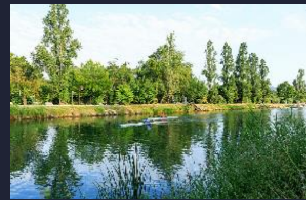
Les berges de Siagne comme espace sportif