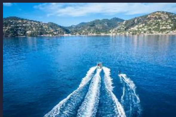
La Méditerranée pour terrain de jeu