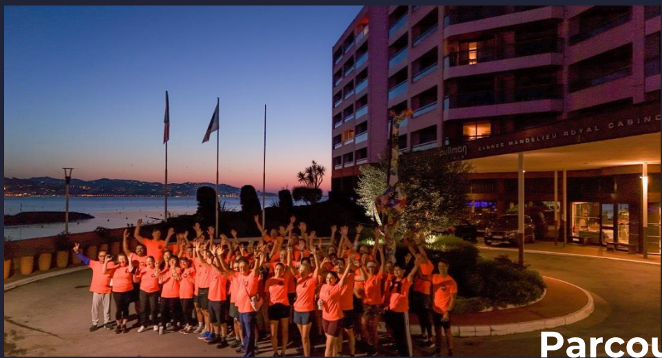
Parcours en Bord de Mer