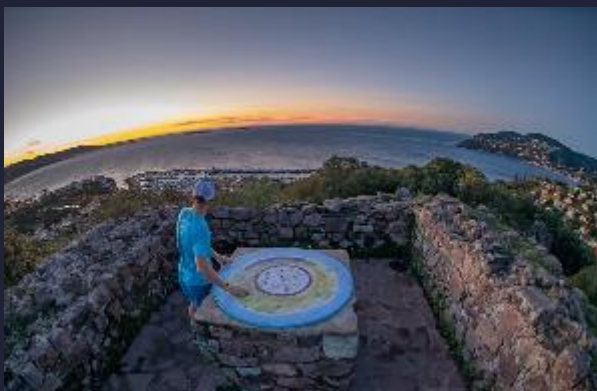
Le Mont San Peyre Un panorama à 360°