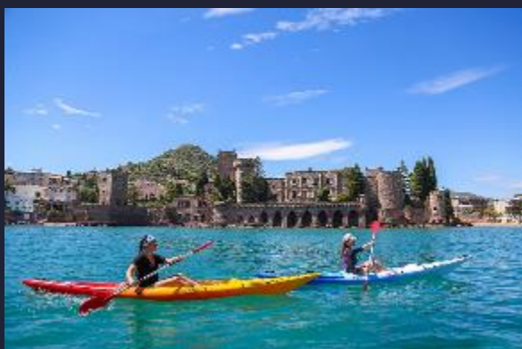
Le Château de La Napoule pour repère