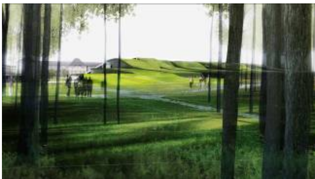
Lycée Marcel Sembat – Sotteville les Rouen