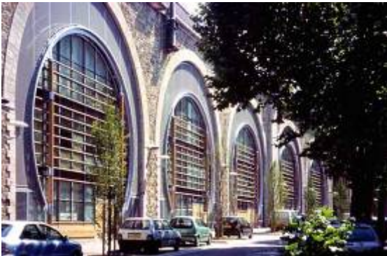
Espaces culturels – Issy-Les-Moulineaux