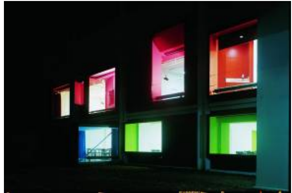
UFR Arts de l'Université Paris 8-Saint-Denis